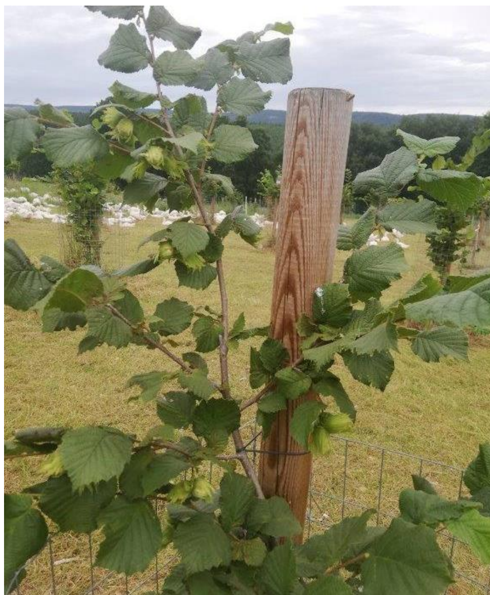
Angießen der Neupflanzungen Frühjahr 2020