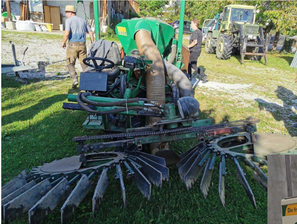
Nusserntemaschine Eigenbau in Bayern 2023