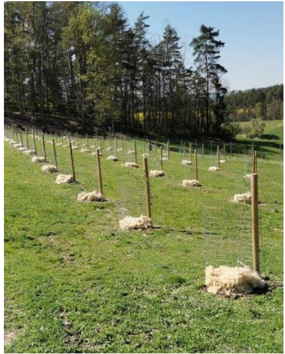
Angießen der Neupflanzungen Frühjahr 2020