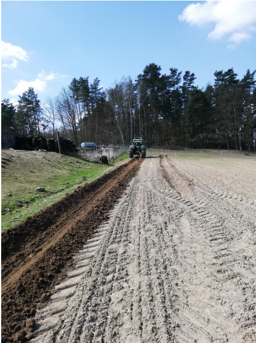
Pflugfurche Frühjahr 2019