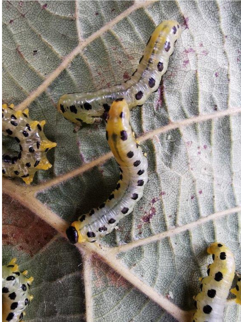
Raupen der Blattwespe Oktober 2022