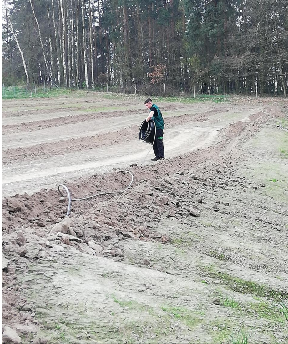
Bewässerungsschlauch auslegen April 2019