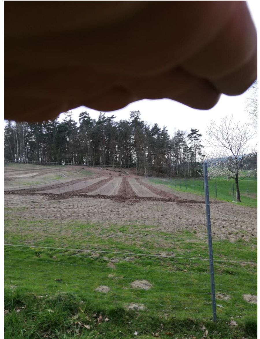
Bodenvorbereitung April 2019