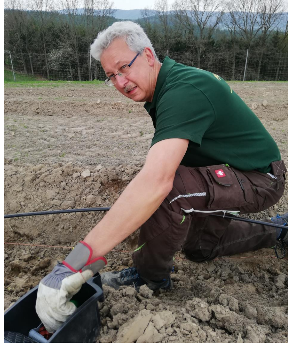
Tropfer anbringen April 2019