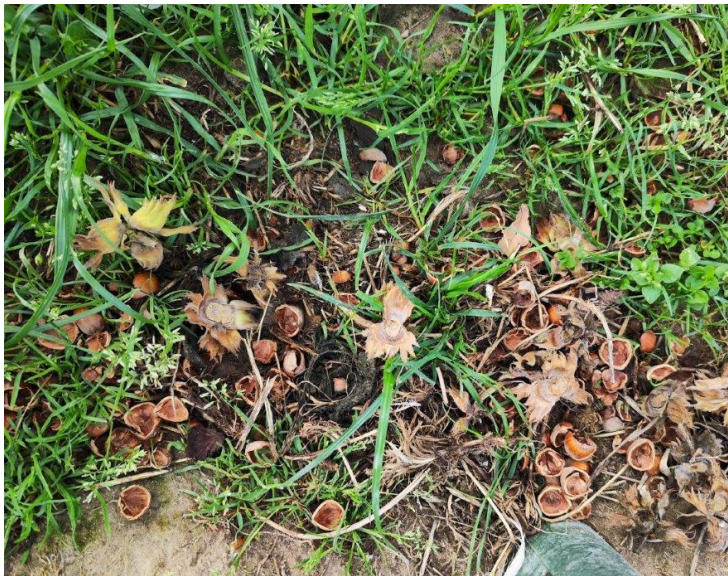
Nager bedienen sich an der Ernte