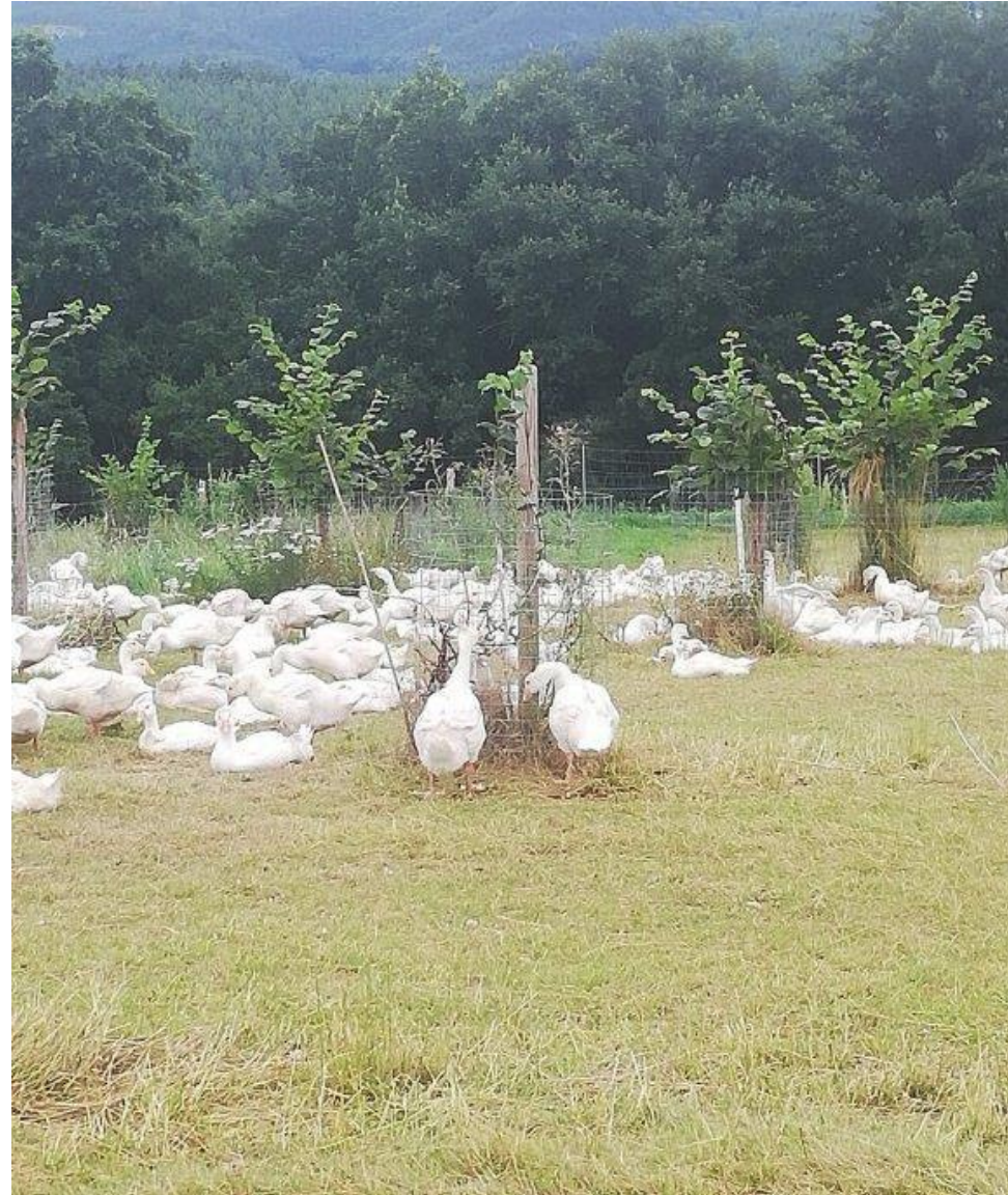
Zweitnutzung mit Gänsen im August