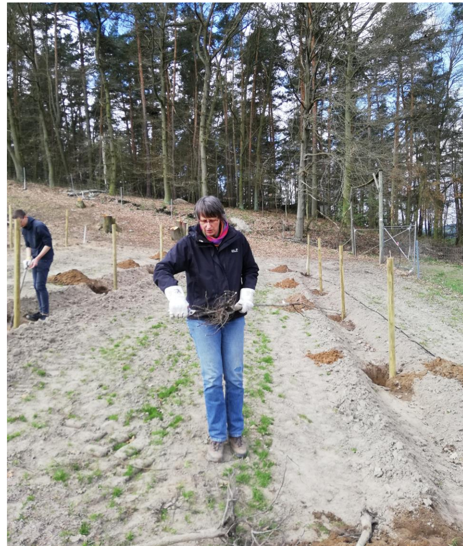
Wurzelschnitt April 2019