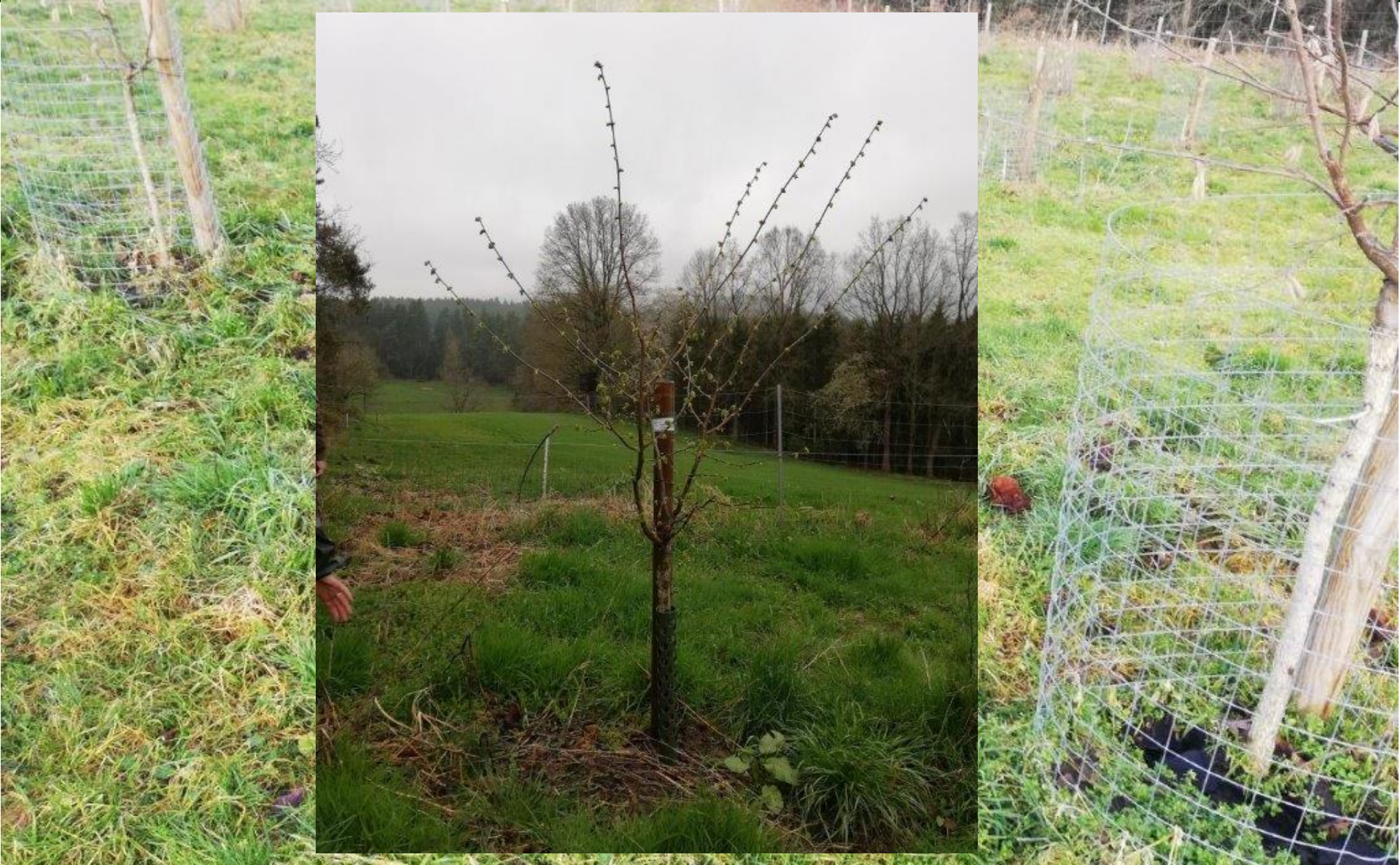
Neuer Stammschutz im Februar 2022 sowie Baumschnitt in Spindelform