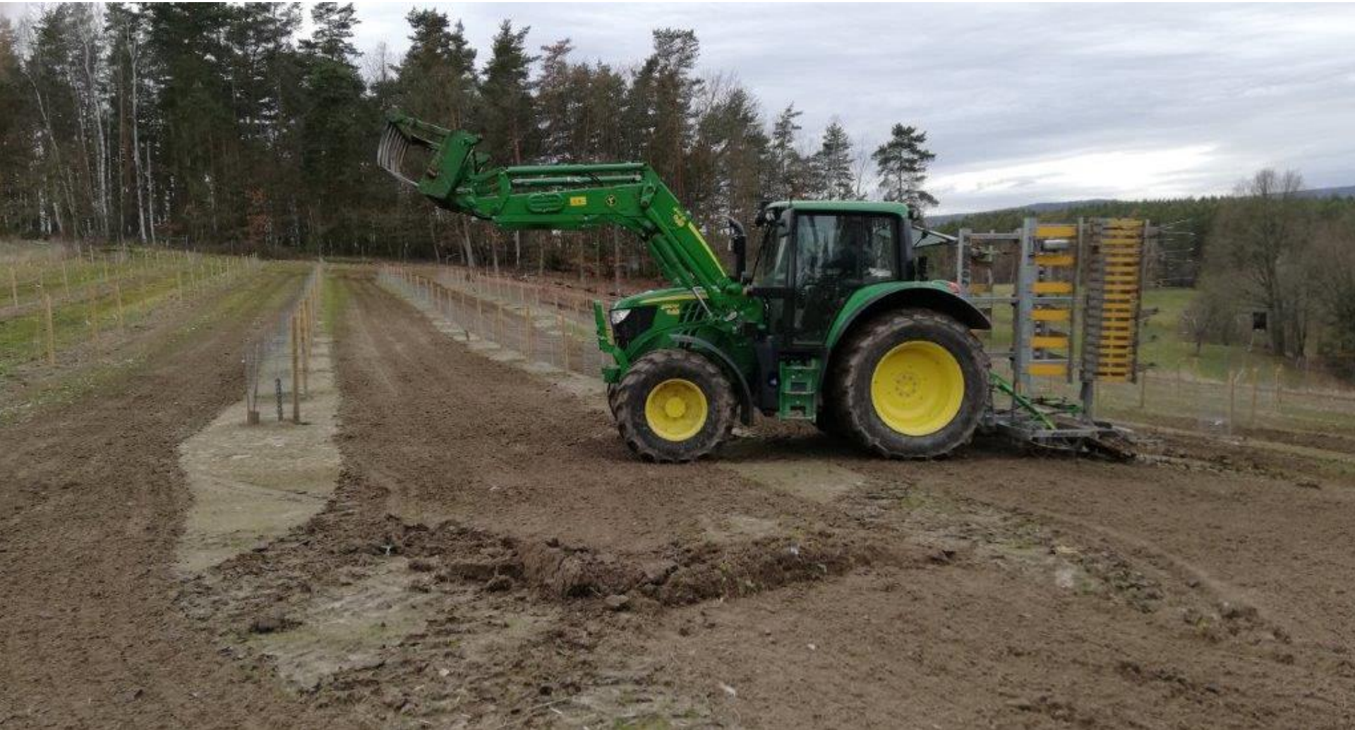
Drahtgitter als Baumschutz und weitere Pflanzungen 2020