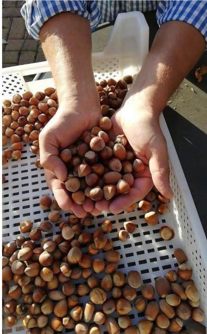
erste Ernte im Oktober 2021