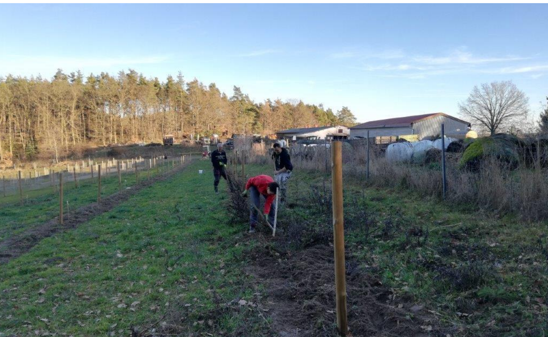
Weitere Pflanzungen im Herbst 2020