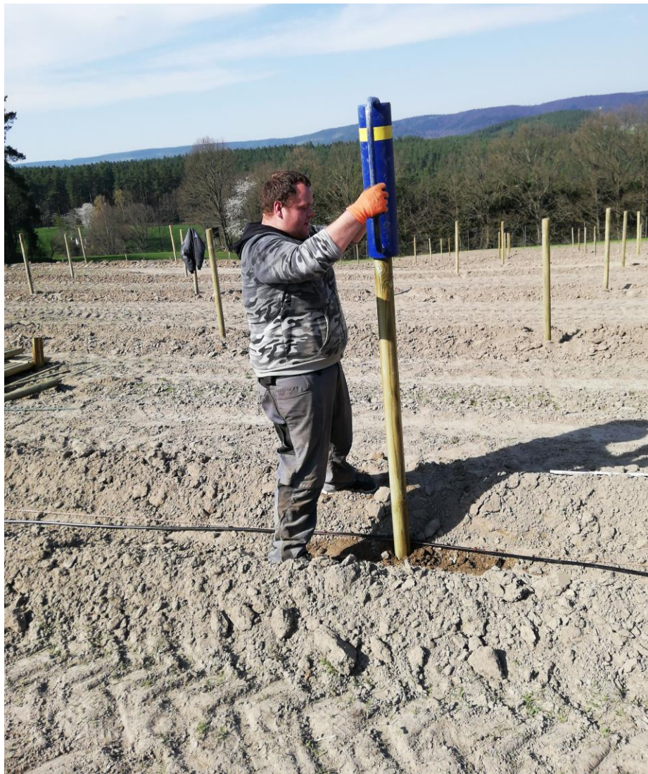
Holzpfähle einrammen April 2019